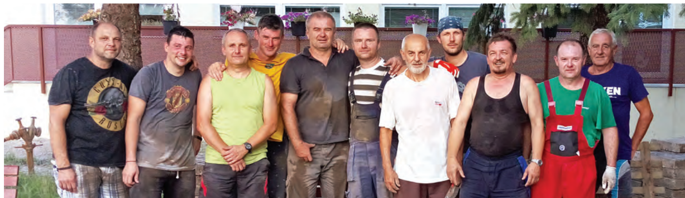
Na podnet riaditeľa školy sa uskutočnila 26. júla 2019 brigáda za materskou školou, kde bolo potrebné premiestniť a poukladať betónové dlaždice, na čo sa ochotne podujali futbalisti - Starí páni.