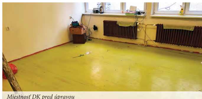
Miestnosť DK pred úpravou