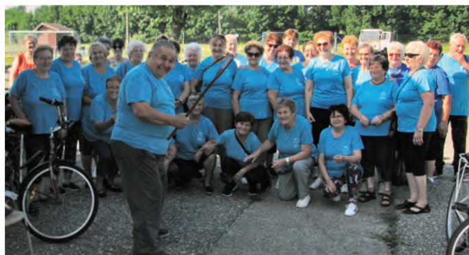
Prevoz kompu cez Váh