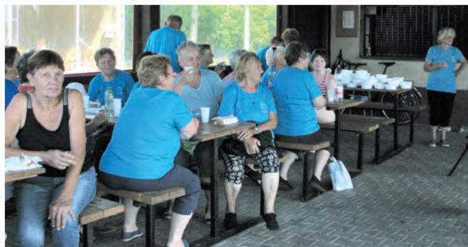
Na záver vyhodnotenie a spoločné občerstvenie