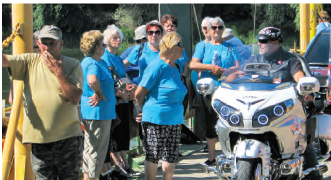
Príprava na odštartovanie Tour de Váh