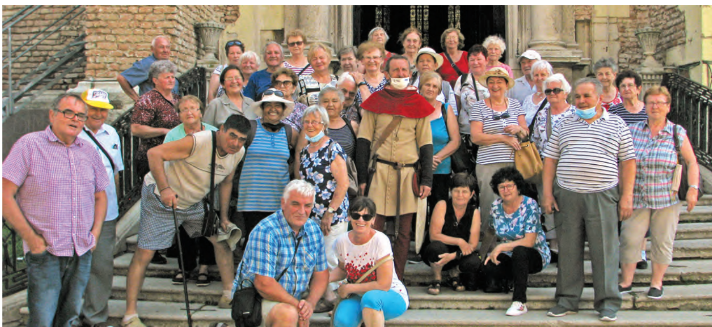
Pred bazilikou sv. Mikuláša