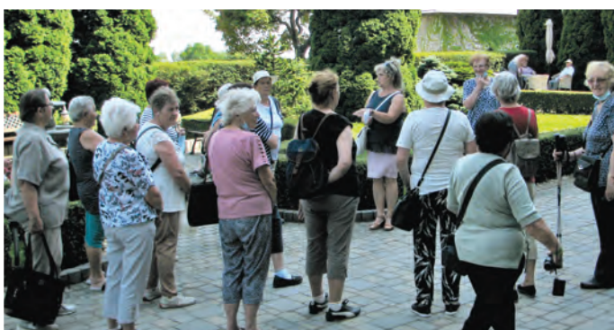
Nádvorie pred vstupom so Smolenického zámku