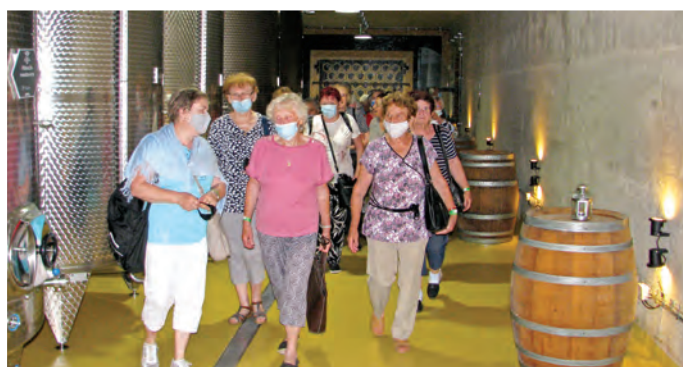
Prehliadka Medolandie v Dolnej Krupej