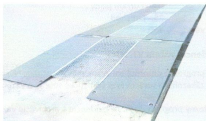
Obrázok 18 m váhy PREMOVA O2 -60t/18m